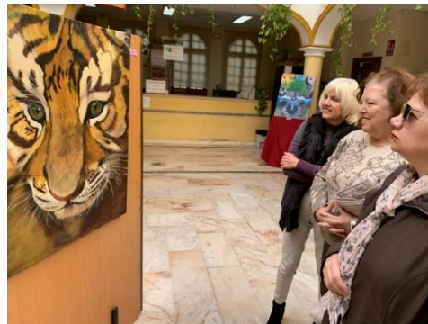
Actividades por el Día Mundial del Alzheimer