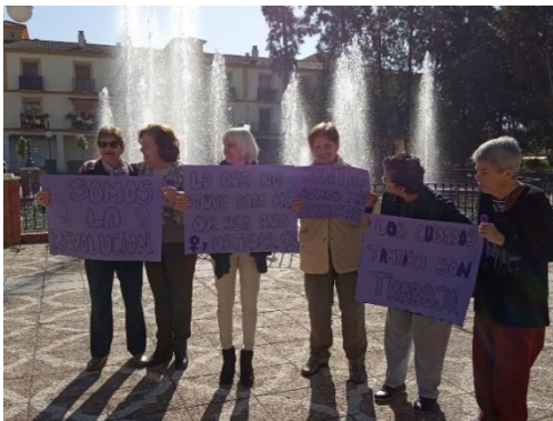
Día de la mujer

Parte del equipo de AFA Aljarafe se trasladó a AFA VITAE en San Fernando (Cádiz) para formarse en las terapias de estimulación cognitiva.